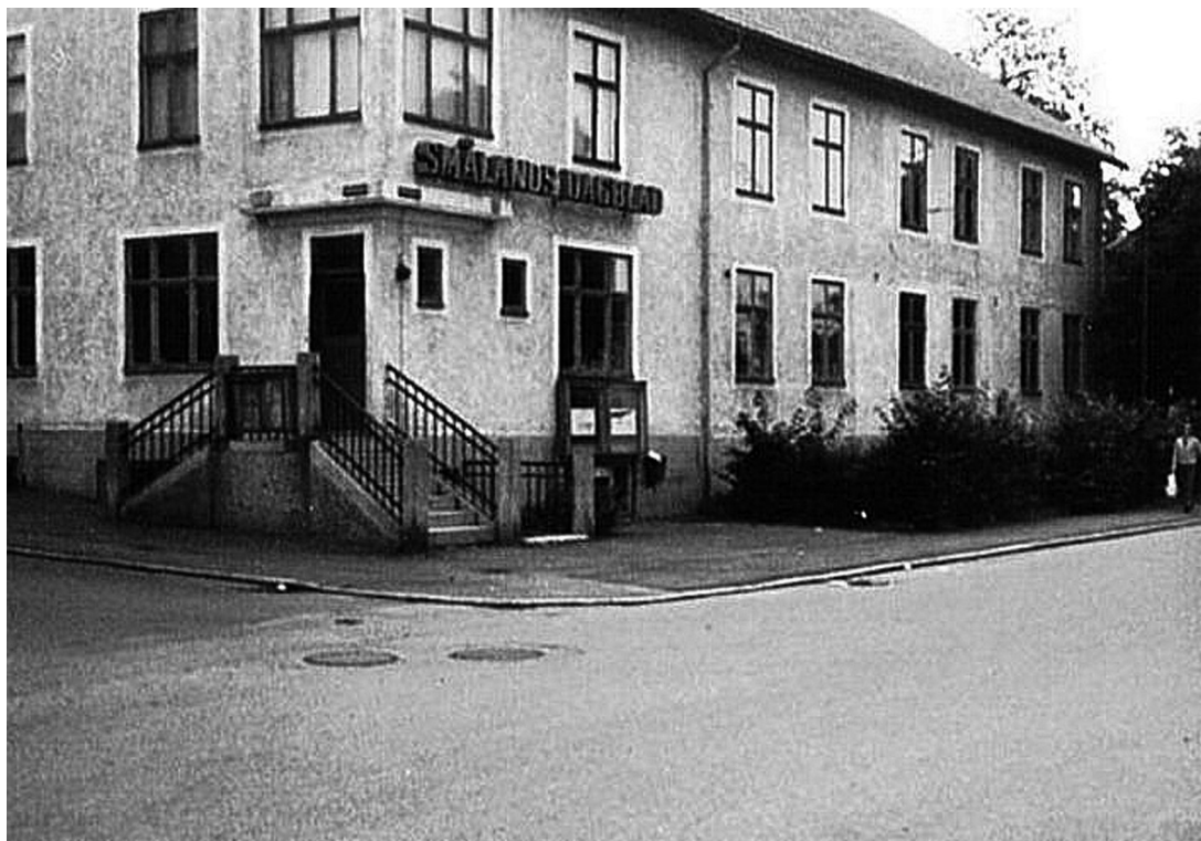
Östra Järnvägsgatan 20 Ringius fastighet med Smålands Dagblads redaktionslokaler i bottenvåningens norra del. Fastigheten revs 1971 och Sparbanken byggde följande år ett större hörnhus mot Storgatan med lokaler för post och bank.

ställde upp, avbeställde sin Afrikabiljett och for 1897 till Stockaryd, där han snart blev delägare i firman.