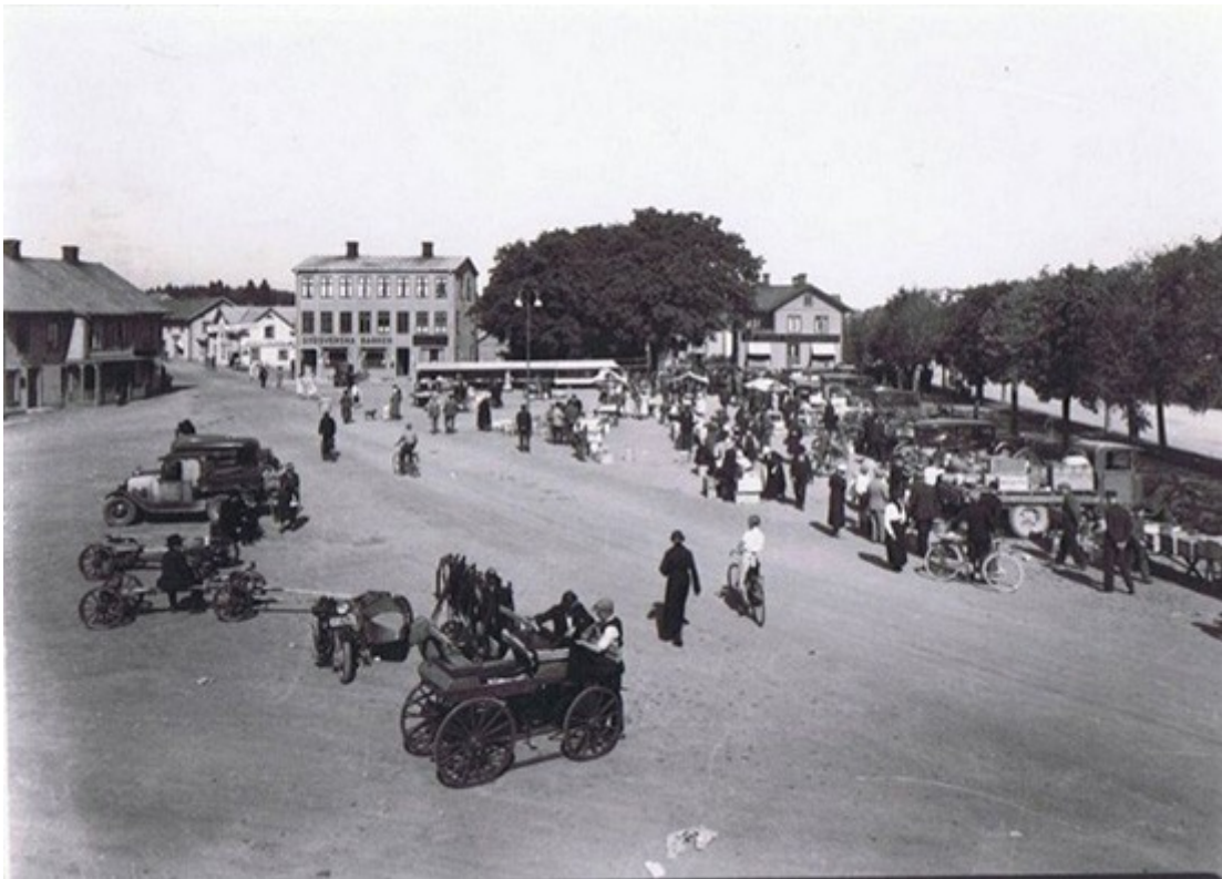
Marknadsdag. De flesta hästskjutsarna har ersatts av lastbilar och bilar. Jungs, byrån, Elwings, Köpmangatan. Bilden är från: omkr. 1930

Vi möts och vi skiljs ibland utan tårar. Träffa våra medmänniskor vill vi gärna. Tidigare var vägskäl, mjölkbryggor, handelsbodar och gathörn självklara mötesplatser. I det gamla Sävsjö var Politiska knuten, bommarna vid järnvägsövergången och Stora torget arenor där männen löste världsproblemen och utbytte insides nyheter långt före ,